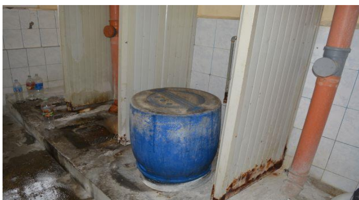
Друг санитарен възел