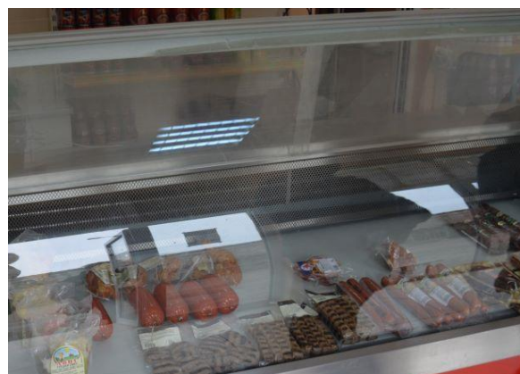
Малотрайни продукти, които се продават в лавката