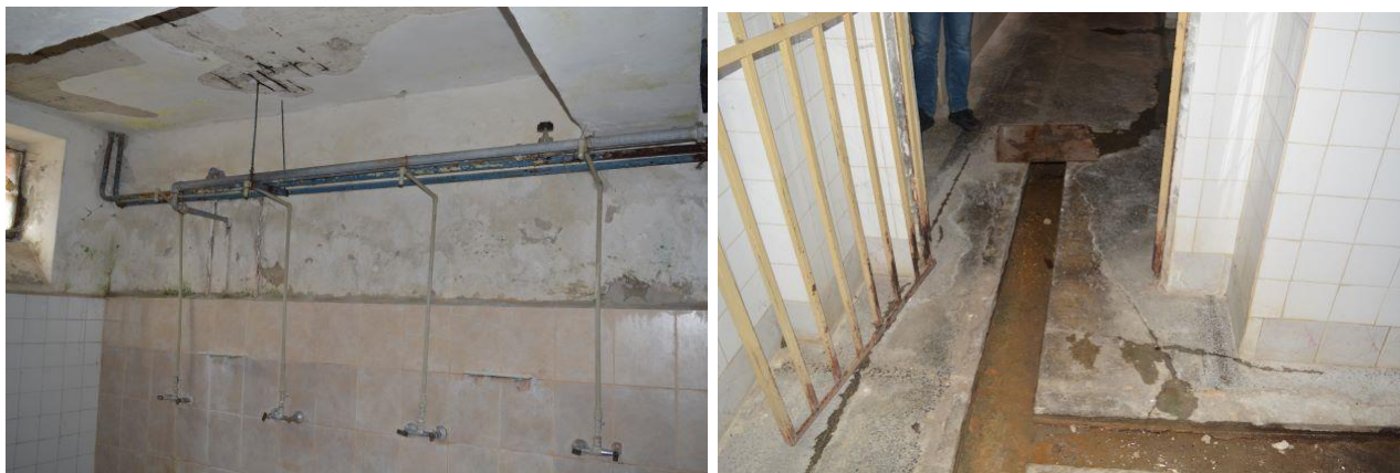
Снимки от общата баня

В деня на проверката (01.03.2022г.) в затвора – гр. Ловеч са настанени 217 лица, изтърпяващи наказание „лишаване от свобода“. Капацитетът на съоръжението на база 4 кв.м. е за 383 лица. В момента затворът в град Ловеч и трите затворнически общежития към него предоставят възможност за настаняване на 825 лишени от свобода, при 4 кв.м. на едно лице, в СБАЛЛС – 160 лишени от свобода, а в следствения арест – 24 задържани лица.