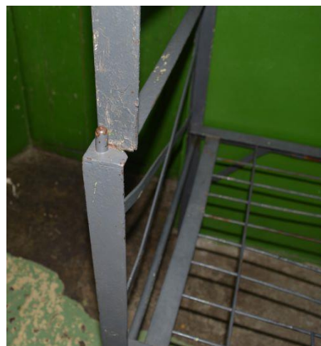
Подовете в част от спалните помещения са бетон Легло в спално помещение