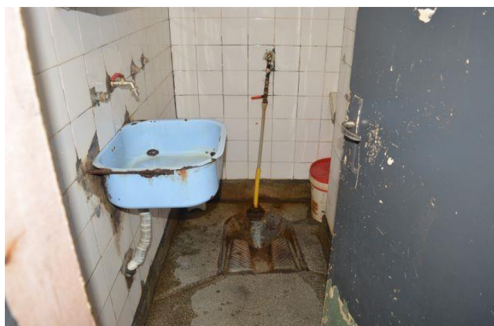
Санитерен възел в спално помещение