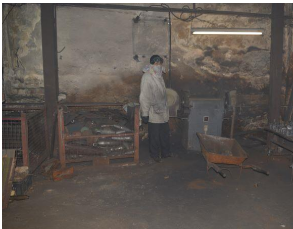
Снимка от цеха за металообработване

На 21.01.2022 г. Изпълнителна агенция „Главна инспекция по труда“ /ГИТ/- гр. Ловеч е извършила проверка за спазване изискванията на трудовото законодателство и осигуряване на здравословни и безопасни условия за труд в Цех Дърводелна и Зеленчукова градина. Изготвен е протокол с констатирани 10 нарушения. Дадени са предписания и едномесечен срок на Държавно предприятие „Фонд затворно дело“ за отстраняване на допуснатите нарушения. В проверката не е включен Цех металообработване. В протокола на ГИТ не фигурират констатираните от екипа на НПМ нездравословни условия за труд в Цех Дърводелна.