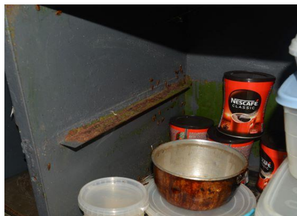
Шкаф, пълен с хлебарки

Задържано лице, показва чаршафа си с петна от кръв на дървеници и хлебарки